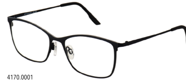
4170.0001 black tie/moody moon