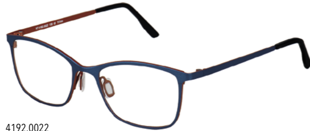
4192.0022 algae/rosé gold