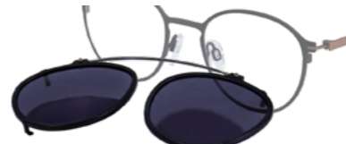
4168.C01 Sonnenschutz Clip (grau 85%, Filter 3)