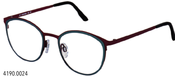
4190.0024 hibiscus /lush greenery