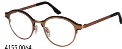
4155.0064 rosé gold/schwarz