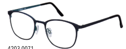
4203.0071 nighthawk/lush greenery