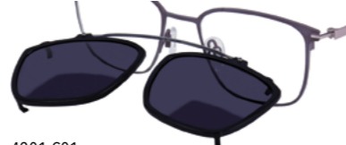
4201.C01 Sonnenschutz Clip (grau 85%, Filter 3)