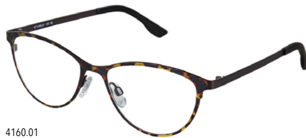
4160.01 antik braun/braun Muster matt