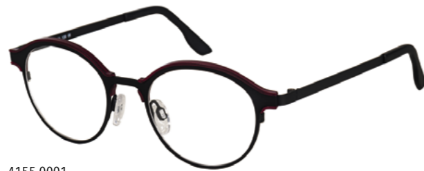
4155.0001 black tie/rot