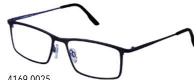
4169.0025 on the rocks/indigo