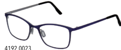
4192.0023 rich iris/moody moon