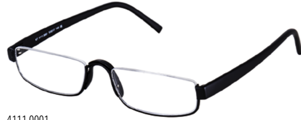
4111.0001 black tie

4111 51/17 53/17 - 143 · Edelstahl/Monel · anatomische Brücke · Kunststoff-Bügel