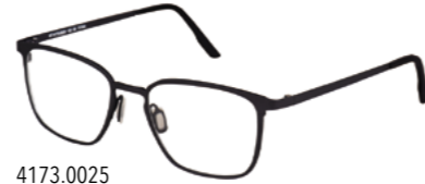
4173.0025 on the rocks