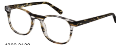
4209.2129 brown-grey stripes