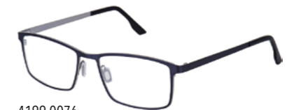
4199.0076 dancer in the night/moody moon