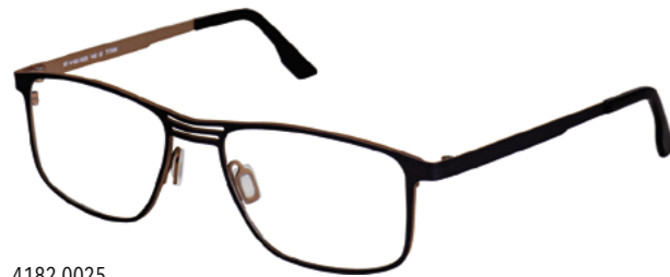
4182.0025 on the rocks/rosé gold