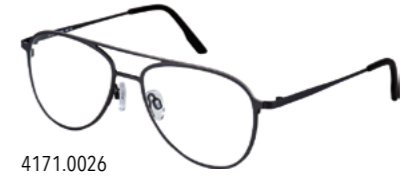
4171.0026 anthracite/moody moon