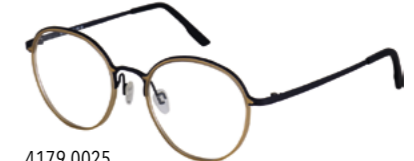
4179.0025 on the rocks/hellbraun