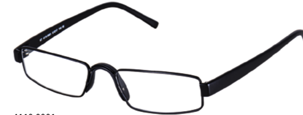
4110.0001 black tie