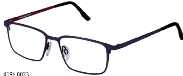
4196.0023 rich iris/hibiscus