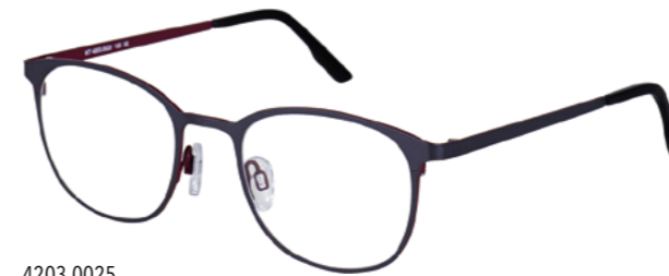
4203.0025 on the rocks/hibiscus