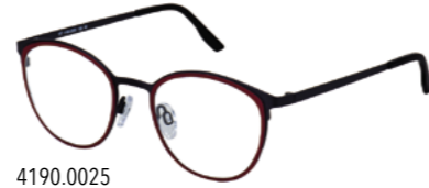
4190.0025 on the rocks/hibiscus