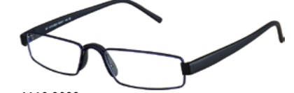
4110.0023 rich iris