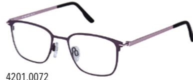
4201.0072 damask/moon flower