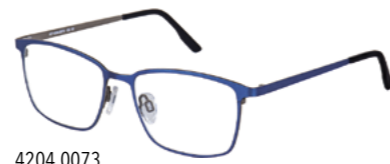
4204.0073 moonlight meadow/mossy mocca