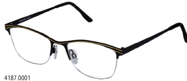
4187.0001 black tie/gold