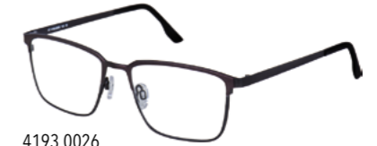
4193.0026 anthracite/espresso lane