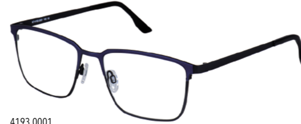
4193.0001 black tie/rich iris