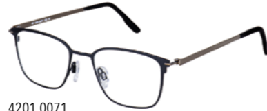
4201.0071 nighthawk/bleached cedar