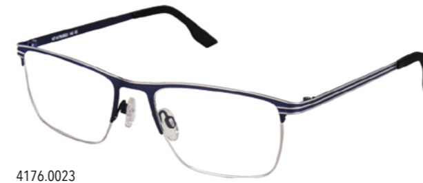
4176.0023 rich iris/antic silver