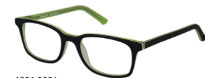
4981.2056 schwarz/grün matt