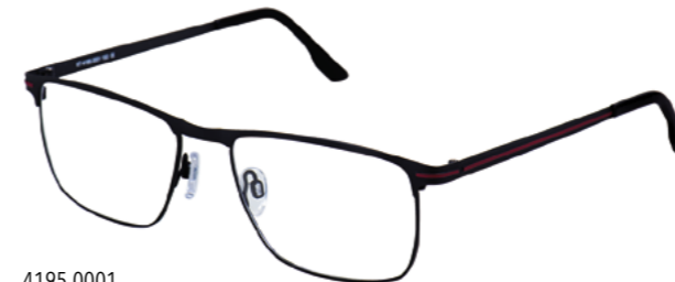
4195.0001 black tie/hibiscus