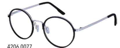
4206.0077 lucy in the sky/black matt