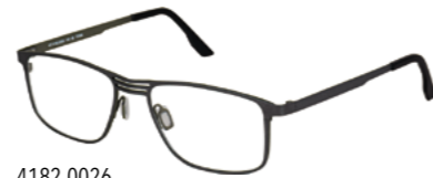
4182.0026 anthracite/bleached cedar