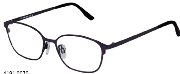
4191.0070 dragons daughter