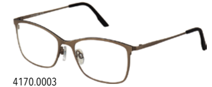
4170.0003 bleached cedar /black tie