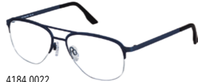
4184.0022 on the rocks/algae/rich iris