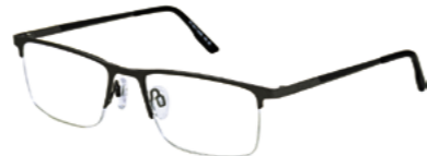
4211.0026 anthracite/dancer in the night