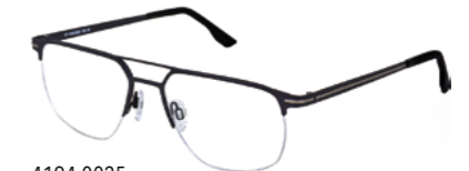
4194.0025 on the rocks/bleached cedar