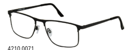
4210.0071 nighthawk/black tie matt