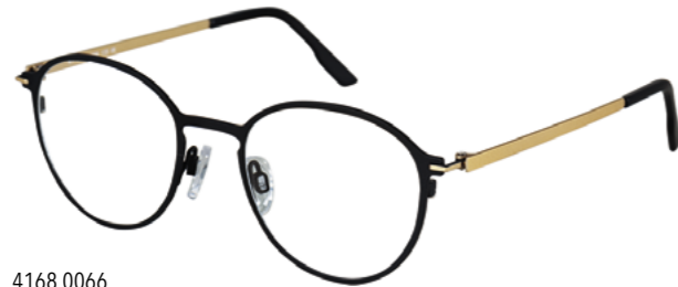
4168.0066 black tie/gold