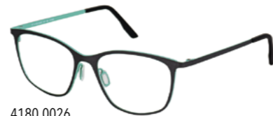
4180.0026 anthracite/pierre de lune