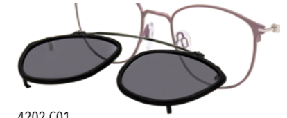
4202.C01 Sonnenschutz Clip (grau 85%, Filter 3)