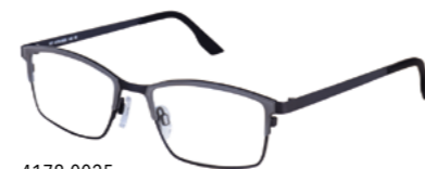
4178.0025 on the rocks/hellgrau