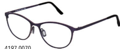
4197.0070 dragons daughter/moon flower