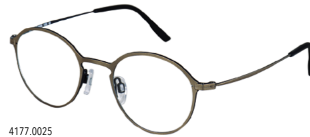
4177.0025 on the rocks/bleached cedar