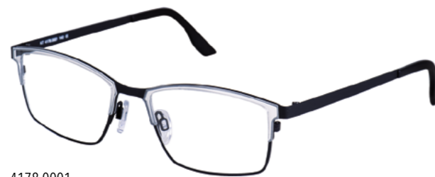
4178.0001 black tie matt/kristall glänzend