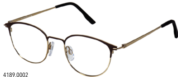
4189.0002 gold glänzend/espresso lane