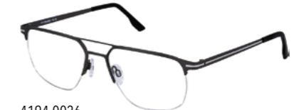
4194.0026 anthracite/moody moon