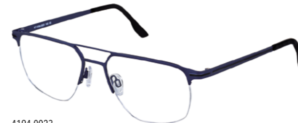
4194.0023 rich iris/black tie