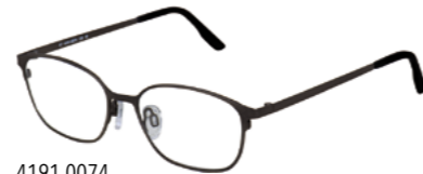
4191.0074 mossy mocca