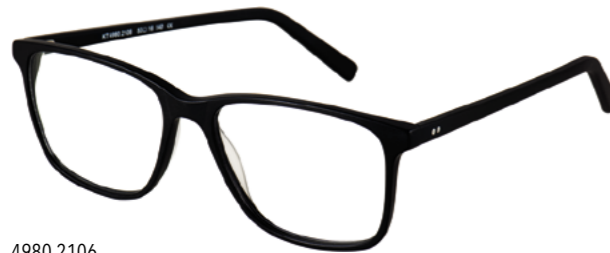
4980.2106 schwarz matt