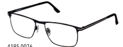
4195.0076 dancer in the night/moody moon