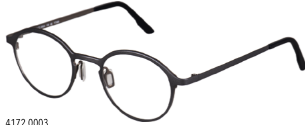
4172.0003 dunkelgrau/bleached cedar