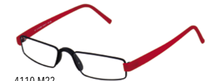
4110-M22 black tie/rot

Bei unseren Modellen 4110 und 4111 sind Mittelteile und Bügel frei kombinierbar. Die Bügel sind selbst zu verschrauben. Es gibt sie in folgenden Farben: