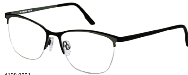
4198.0001 black tie matt/anthracite