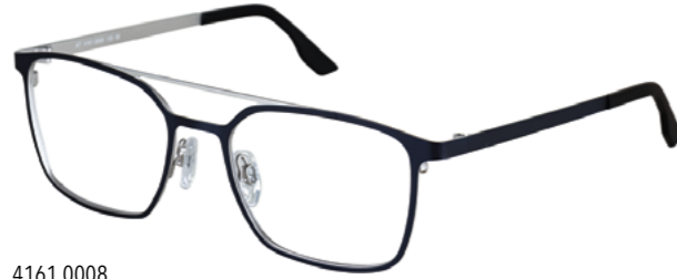
4161.0008 rich iris/moody moon