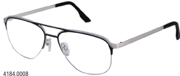
4184.0008 moody moon/on the rocks