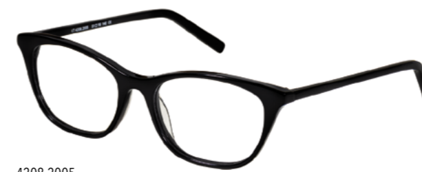
4208.2005 black shiny