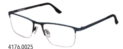
4176.0025 on the rocks/algae