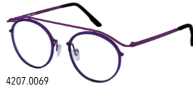
4207.0069 love affair/blue matt