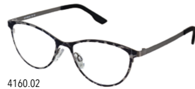
4160.02 antik gun/schwarz Muster matt