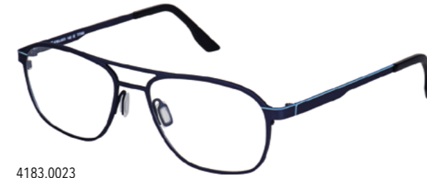
4183.0023 rich iris/pierre de lune