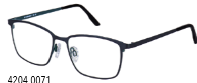
4204.0071 nighthawk/lush greenery