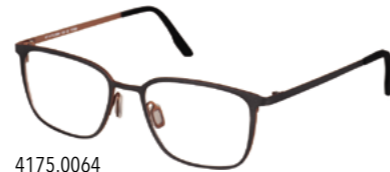
4175.0064 dunkelgrau/rosé gold