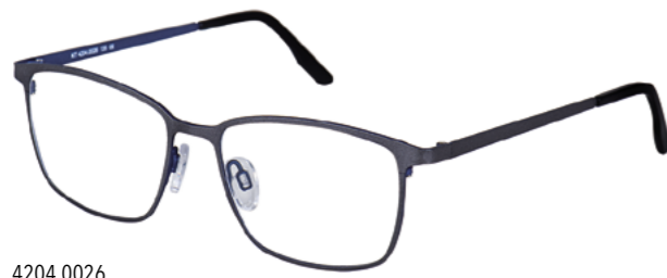
4204.0026 anthracite/moonlight meadow