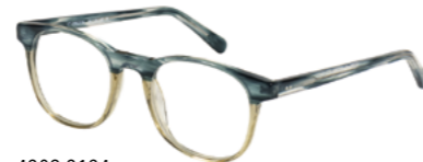
4209.2134 green marble/transparent brown