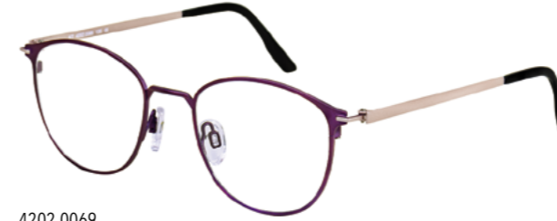
4202.0069 love affair/moon flower