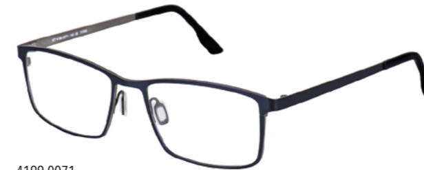
4199.0071 nighthawk/dancer in the night