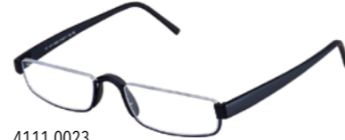
4111.0023 rich iris