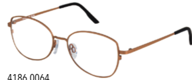
4186.0064 rosé gold