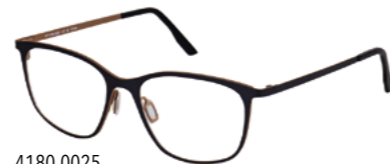
4180.0025 on the rocks/rosé gold