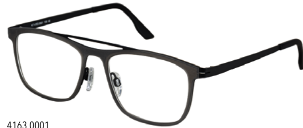
4163.0001 black tie/grau