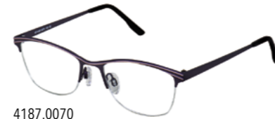
4187.0070 dragons daughter/moon flower