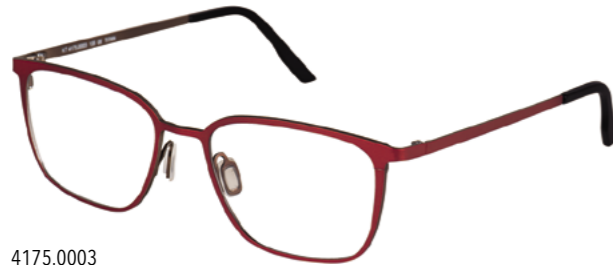
4175.0003 rostrot/bleached cedar