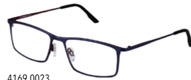
4169.0023 rich iris/hibiscus semi