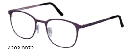
4203.0072 damask/moon flower