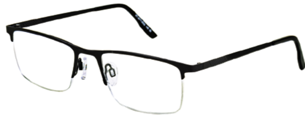
4211.0025 on the rocks/nighthawk