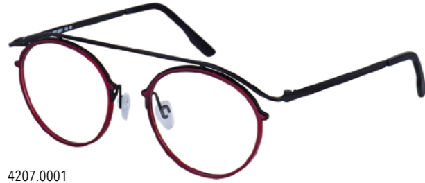
4207.0001 black tie matt/red matt

4207 48/20 - 135 - Edelstahl/Grilamid TR90