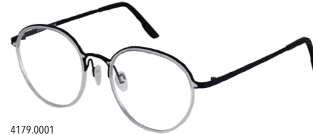
4179.0001 black tie/kristall