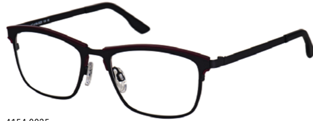
4154.0025 on the rocks/rot