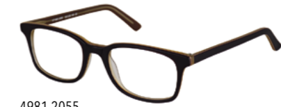
4981.2055 braun/kaffee matt