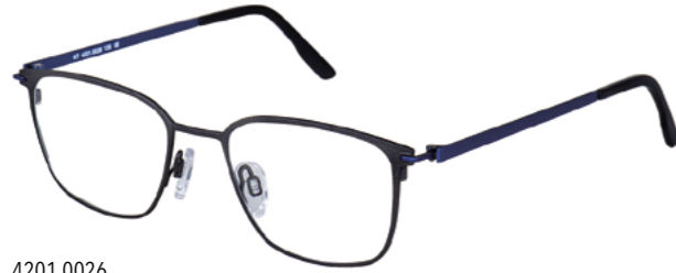
4201.0026 anthracite/moonlight meadow