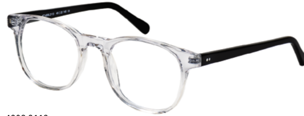
4209.2113 crystal shiny