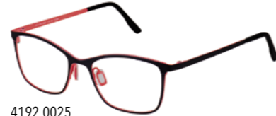
4192.0025 on the rocks/watermelon