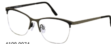
4198.0074 mossy mocca/on the rocks