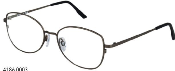
4186.0003 bleached cedar