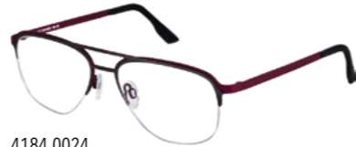
4184.0024 hibiscus /anthracite