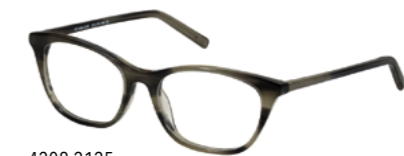
4208.2125 grey stripes