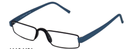
4110-M21 black tie/petrol