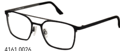
4161.0026 black tie/anthracite