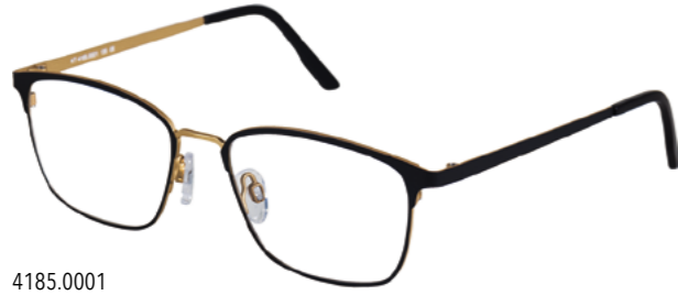
4185.0001 black tie/gold