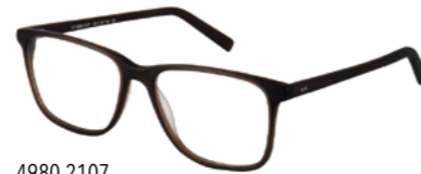
4980.2107 braun matt