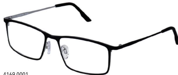
4169.0001 black tie/moody moon