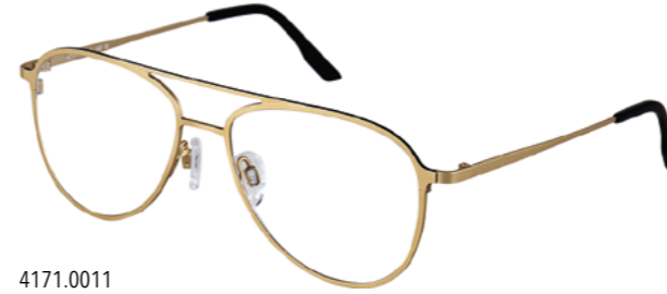
4171.0011 gold/black tie