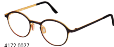
4172.0027 braun metallic/sweet exotic