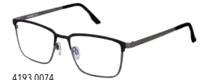
4193.0074 mossy mocca/nighthawk