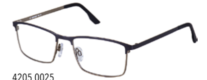
4205.0025 on the rocks/bleached cedar