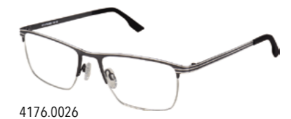
4176.0026 anthracite/moody moon