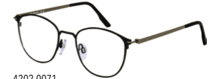
4202.0071 nighthawk/dancer in the night