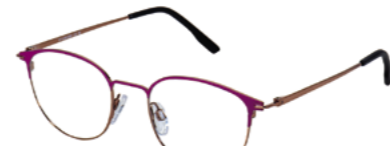
4189.0069 roségold glänzend/love affair