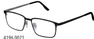
4196.0071 nighthawk/moody moon