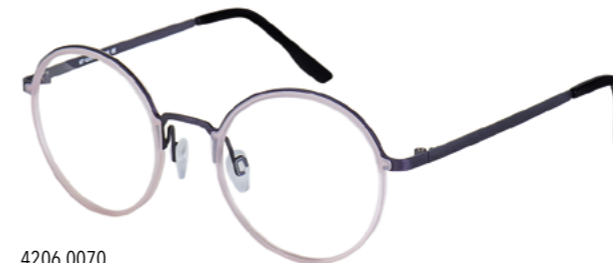
4206.0070 dragons daughter/light pink matt