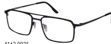
4162.0025 on the rocks