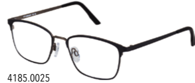
4185.0025 on the rocks/bleached cedar