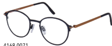
4168.0071 nighthawk/rosé gold