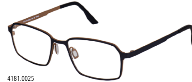
4181.0025 on the rocks/rosé gold