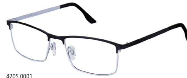
4205.0001 black tie/lucy in the sky