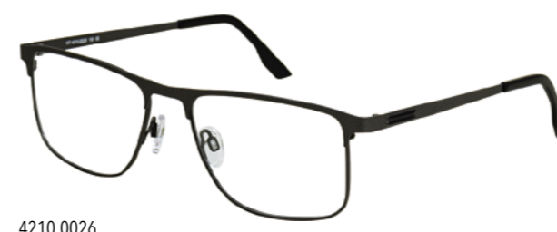
4210.0026 anthracite/dancer in the night