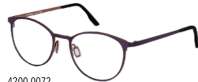
4200.0072 damask/rosé gold