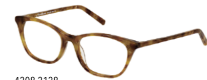
4208.2128 honey marble