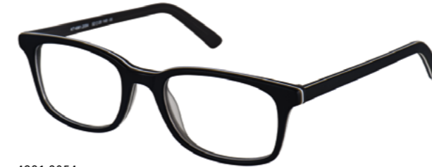
4981.2054 schwarz/braun/weiß matt