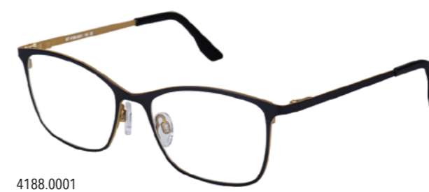
4188.0001 black tie/gold