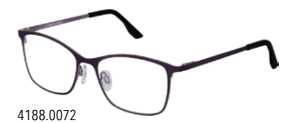
4188.0072 damask/moon flower