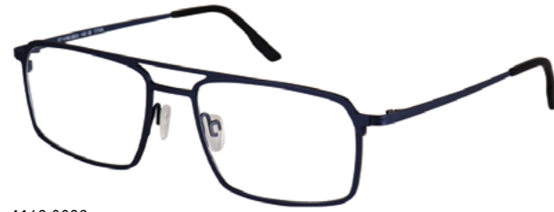
4162.0023 rich iris