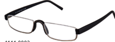
4111.0003 bleached cedar