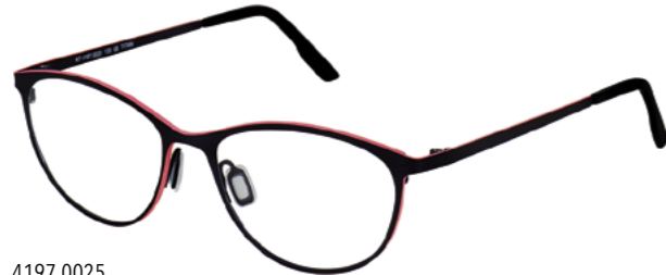
4197.0025 on the rocks/watermelon