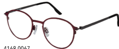
4168.0067 hibiscus semi/anthracite