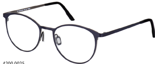
4200.0025 on the rocks/mossy mocca