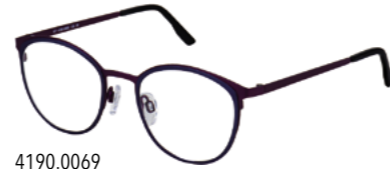
4190.0069 love affair/rich iris