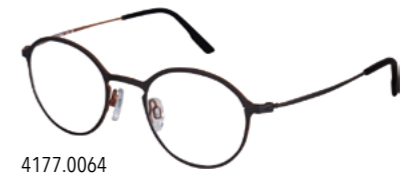
4177.0064 rosé gold/anthracite