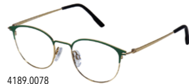
4189.0078 gold glänzend/lush greenery